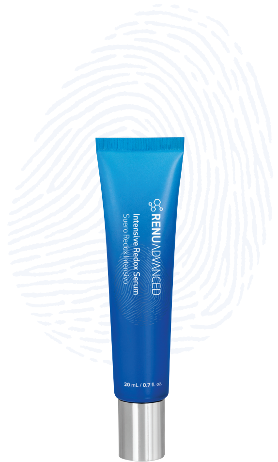
20 mL / 0.7 fl. oz.

ASEA verfügt über ein urheberrechtlich geschütztes Verfahren zur Herstellung lebensspendender Redox-Signalmoleküle. Diese Moleküle unterstützen die Kommunikation auf Zellebene und damit das gesunde, jugendliche Erscheinungsbild Ihrer Haut.